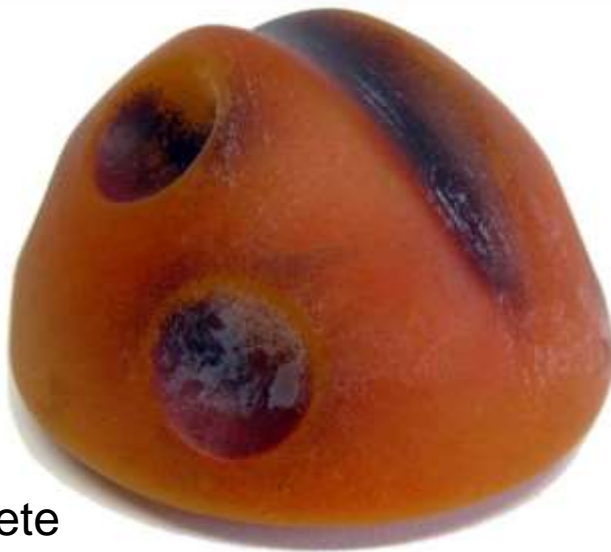
Lisaainete migreerumine pinnale