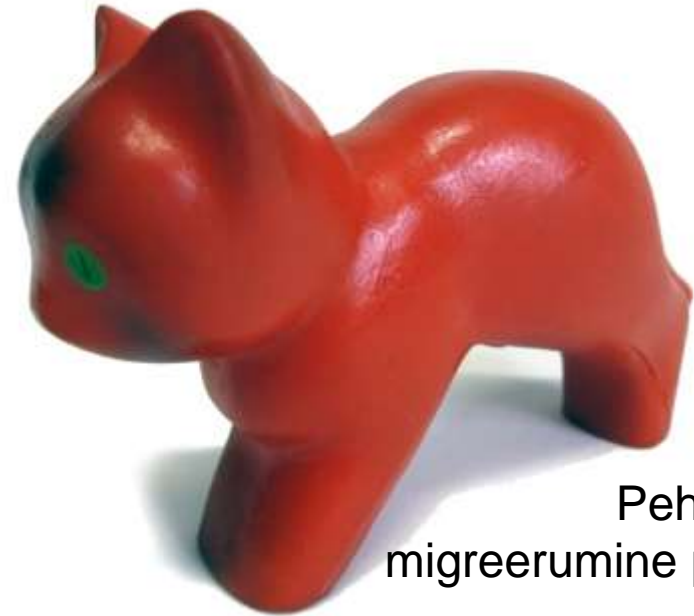
Pehmendi migreerumine pinnale